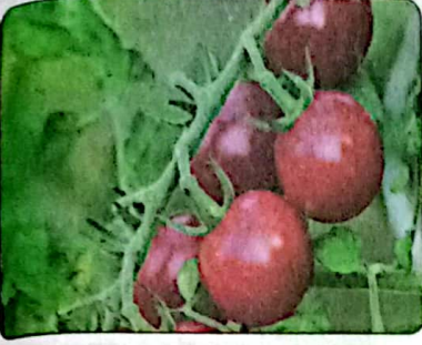
حبّات طماطم ناضجة جاهزة للأكل

• مراحل نمو نبات الطماطم في بعض الفترات: